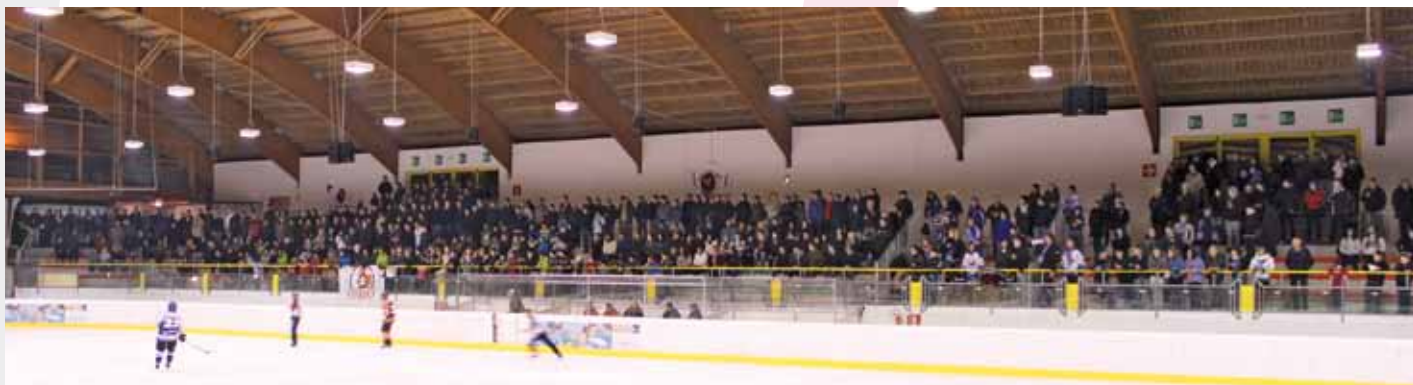
Tolle Zuschauerkulisse im entscheidenden Halbfinalspiel gegen den HC Toblach

Nach den vielen Umstrukturierungen im Sommer beim AHC VINSCHGAU EISFIX waren alle gespannt auf die Saison. Wie bekannt wurde der gesamte Trainerstab durch den Slowaken Ivan Cerny und Benjamin Wunderer gewechselt. Ein neues Trainingskonzept wurde versucht gleich umzusetzen.