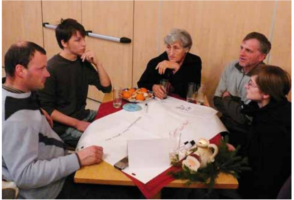
Dorfcafé's waren ein Erfolg, es wurde gemeinsam überlegt und diskutiert!

Die Vielzahl an Ideen, Anregungen und Vorschlägen der Latscherinnen und Latscher wurde nun von der Steuer-