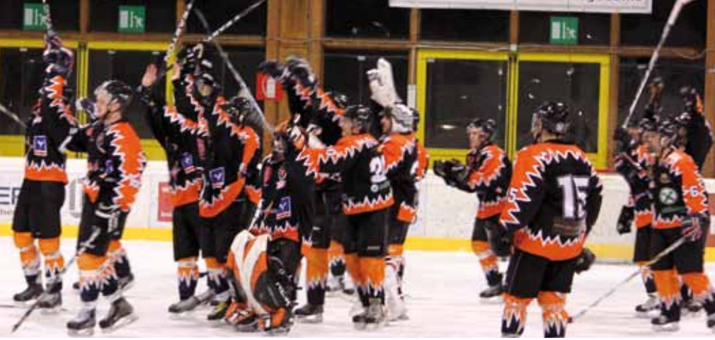
Jubel nach dem Viertelfinale und den Einzug ins Halbfinale der Serie „C“ U26