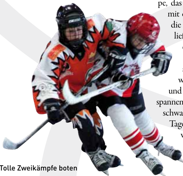
Tolle Zweikämpfe boten auch unseren Jungen EISFIX

Am Ende reichte es dann für den 3. Platz in der Tabelle. Den Trainern ist es gelungen, dass die Mannschaft am Ende zu einer Ein-